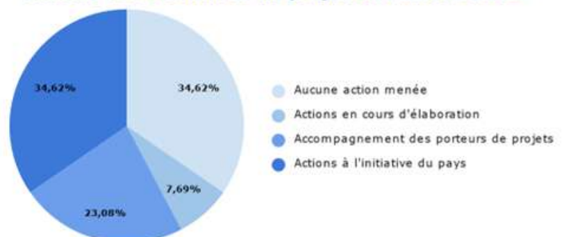
Actions des Territoires de projet en matière d'ESS

- Des politiques volontaristes du Territoire pour un développement du secteur de l'ESS à l'initiative de ce dernier. Cela peut se traduire par la mise en place de dispositifs dédiés (Plans locaux pluriannuels pour l'insertion et l'emploi, Territoire zéro chômeur longue durée...), par la création de guichets uniques pour la subvention et l'accompagnement des acteurs de l'ESS, ou encore par la création, à l'initiative des pouvoirs publics, de structures relevant de l'ESS (incubateur public, tiers-lieux en faveur de la formation numérique et de l'insertion professionnelle...).